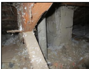
Photo N° 605 AMIANTE CIMENT -- Combles Conduits de fluide Ventilation haute (Fibres-ciment)